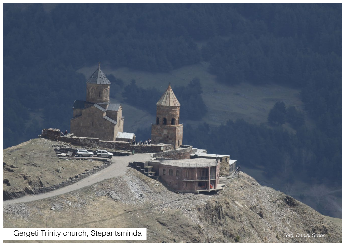
Gergeti Trinity church, Stepantsminda