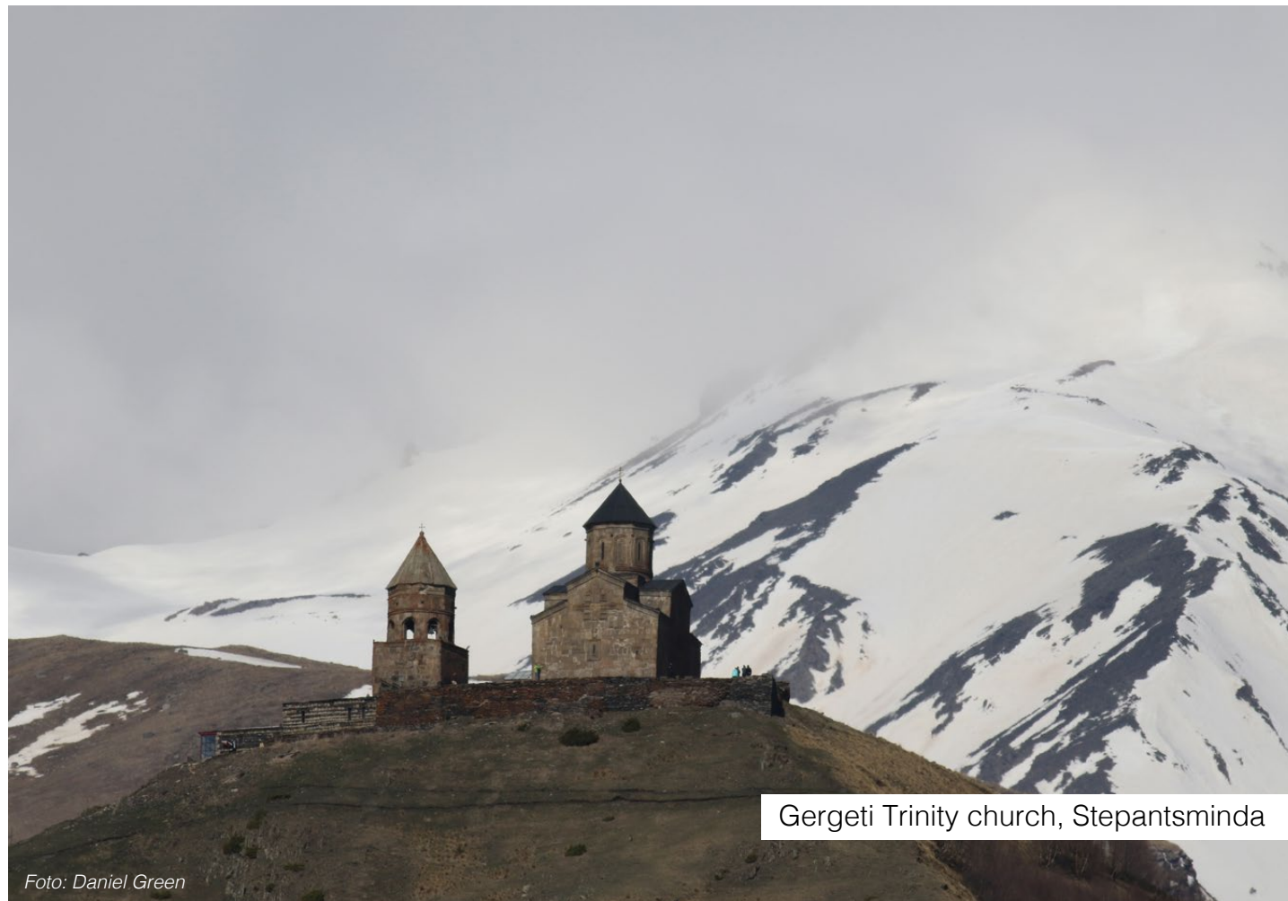
Gergeti Trinity church, Stepantsminda